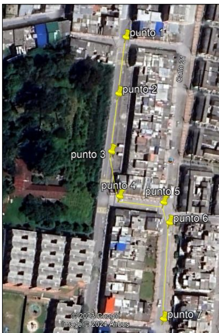
Ilustración 1. Recorrido verificación ambiental

Se realizó recorrido de control y vigilancia en el cuadrante 1, barrio RENACER el día 06 de mayo del 2024, desde las coordenadas 4°42'34,59"N- 74°12'5,748"W hasta las coordenadas 4°42'29,61"N- 74°12'2,13"W (ver ilustración 1. Ruta amarilla), con el fin de verificar las condiciones ambientales, identificar posibles afectaciones a los recursos naturales y realizar las acciones de prevención correspondientes.